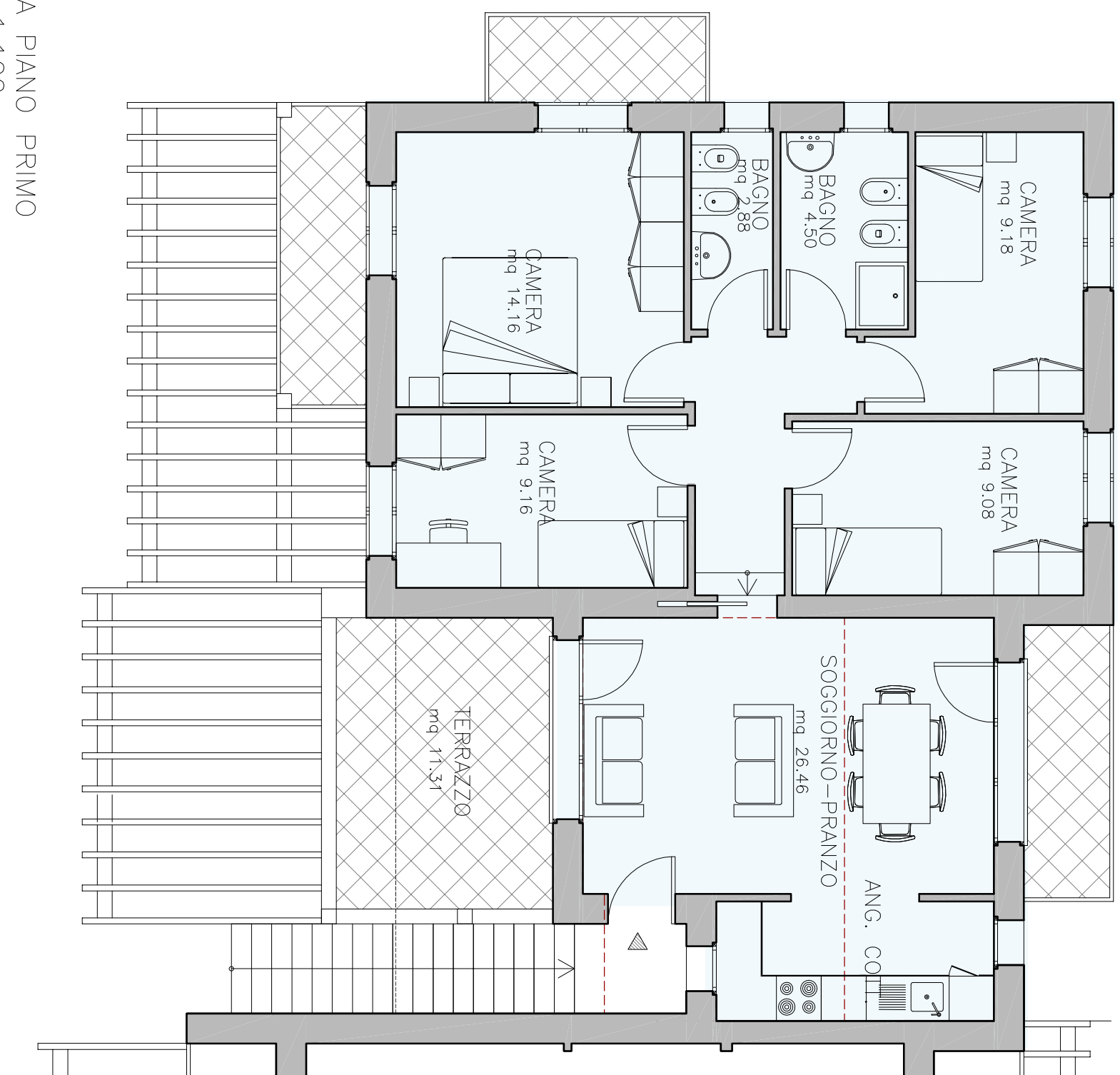
PIANTA PIANO PRIMO scala 1:100

LO SCHEMA E LE DIMENSIONI POTRANNO SUBIRE VARIAZIONI A DISCREZIONE DELLA D.L.