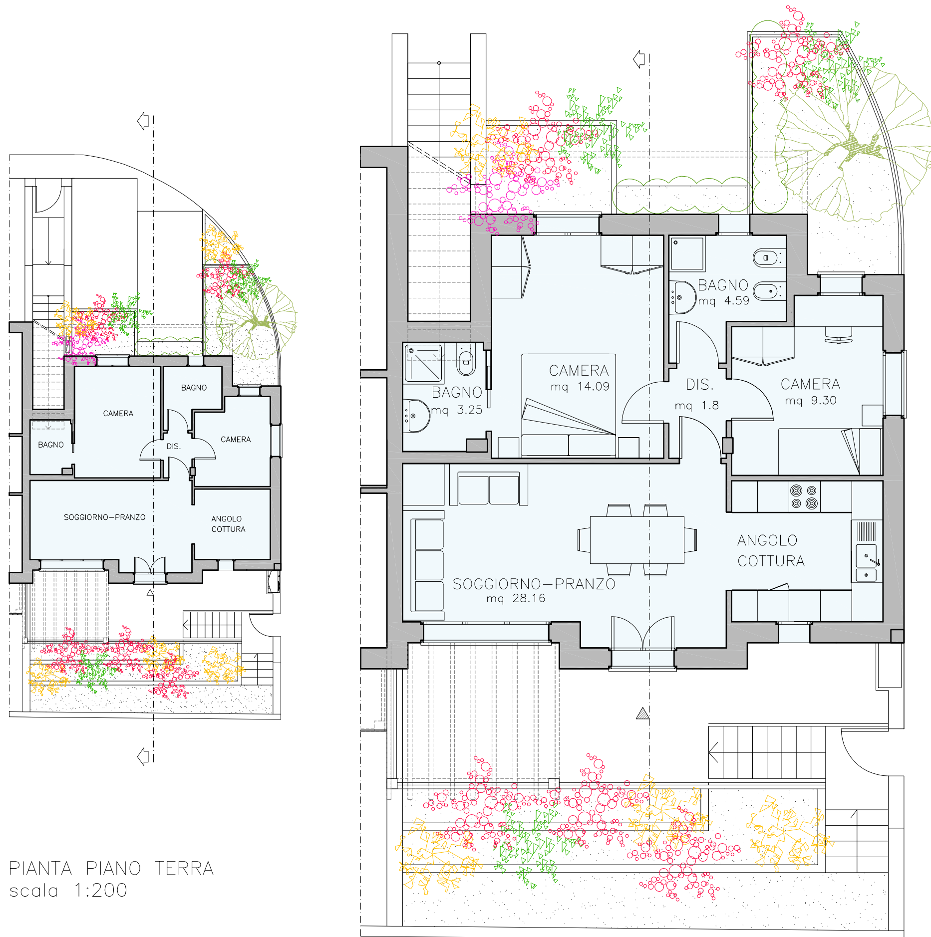
PIANTA PIANO TERRA scala 1:200

LO SCHEMA E LE DIMENSIONI POTRANNO SUBIRE VARIAZIONI A DISCREZIONE DELLA D.L.